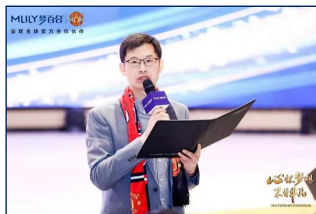
2021年2月28日-3月1日，主题为“心怀梦想 不甘平凡”的2021年梦百合0压床垫经销商峰会在如皋举行